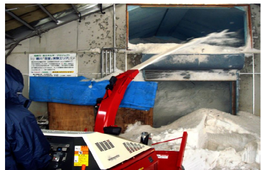
地元の方々による雪の投入

今年のお酒一升瓶1,000本四合瓶1,200本の多くは関東方面に出荷されお味噌400kは市内で販売されて、瞬く間に売れ切れるとか。初秋の蔵出しが待ち焦がれます。